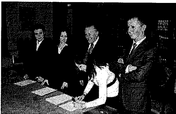
La firma del protocollo da parte dei Giovani Imprenditori Confcommercio